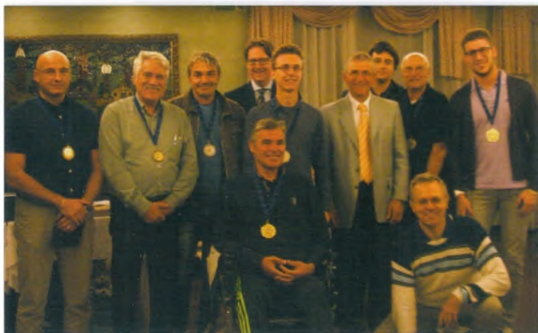
Chioggia – In occasione del decennale, i giocatori che hanno partecipato a tutte o quasi le edizioni dell'Open internazionale hanno ricevuto medaglie d'oro, d'argento e di bronzo

teva vincere, ma solo con un gioco molto accurato: 39. ♖g2 ♖f6 40. ♖h3 ♖g5 41. ♕d5 h4 42. ♕f3 e4 43. ♕d1 f4 44. gxf4+ (dopo 44. g4 f3 il Bianco deve rifugiarsi nello stallo con 45.